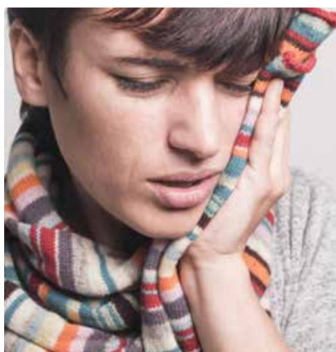
Kalte Winterluft kann unangenehme Zahnschmerzen auslösen.